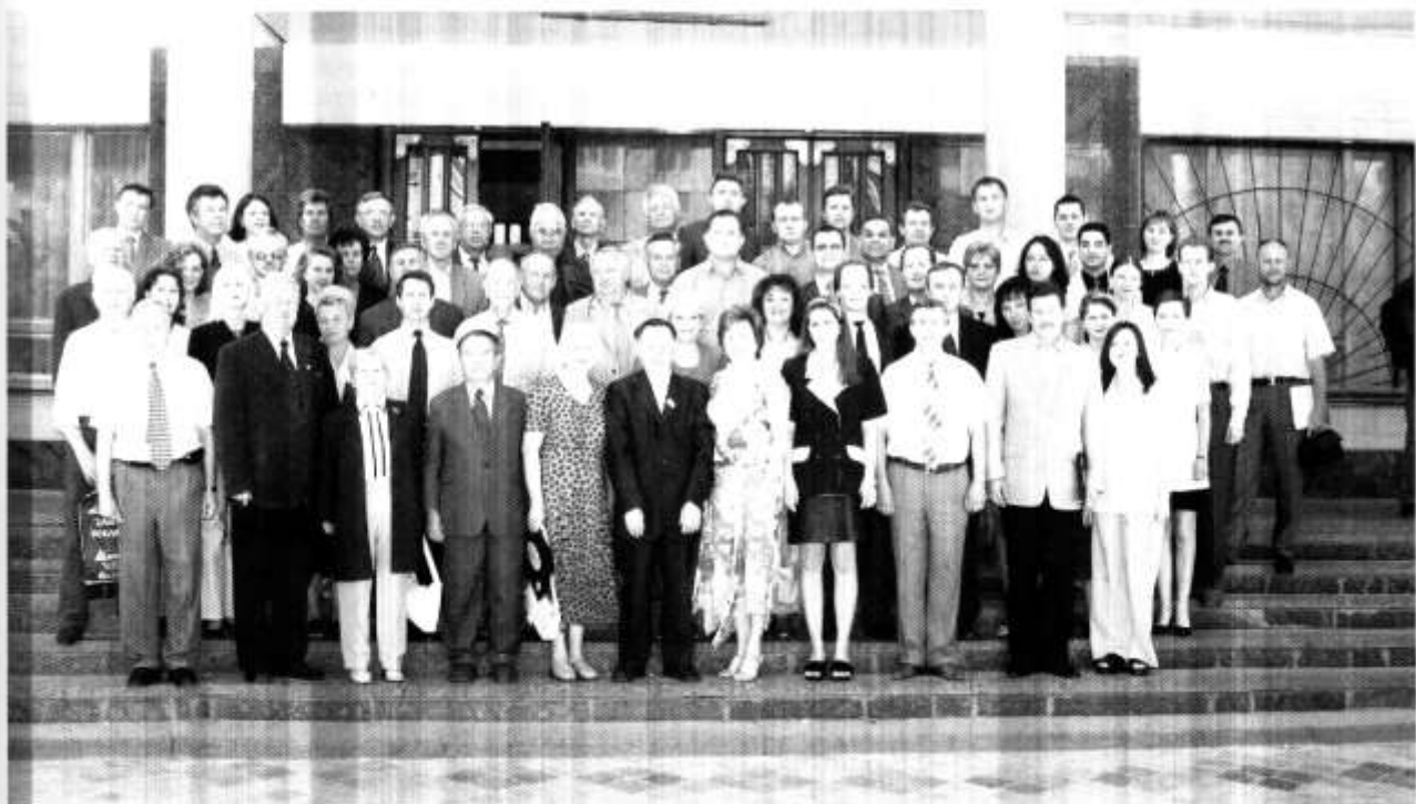
Die Teilnehmer der Konferenz

Da mit der bevorstehenden Osterweiterung der EU auch die Frage der Erschließung neuer Märkte und neuer Standorte mit nach Osten verschoben werden wird, ist diese Öffnung auch eine strategische Frage nicht nur der FH, sondern auch der Unternehmen. Eine praxisorientierte Hochschule sollte diese Entwicklungen nicht verschlafen.